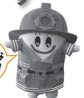
大崎広域消防本部マスコットキャラクター らいすくん