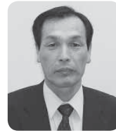
美里町長 あいざわ せい ち 相澤 清一