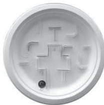
7月は紙皿迷路を作りました