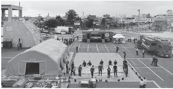
▲大型テント設営訓練の様子