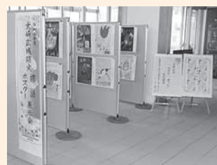
令和4年度の展示会 （大崎市図書館）