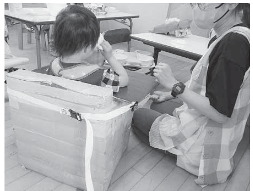
▲牛乳パック椅子。細かくした紙をつめているので、安定して座ることができます。

ほなみ園の公開講座は、大崎地域の保育所・幼稚園等の職員を対象に、障がい児に対する専門知識や技術を広めることを目的として行っています。今年度は7月下旬に3日間の日程で実施し、16施設の職員の方に参加いただきました。当日は、個別に質問や相談などがしやすいよう少人数のグループに分かれて、各クラスの療育風景を見学しました。 給食の時間に使用している椅子について、園児一人一人の発達や体型にあわせてほなみ園職員が手作りをしていることが紹介され、牛乳パックを利用して作られていること、正しい姿勢で座れることで指先を上手に使えるようになることなどの説明があり、参加者は熱心に耳を傾けていました。 講座終了後のアンケートでは、「子どもたちが落ち着いて過ごせるように感じた」「ほなみ園のさまざまな取り組みを実際に見て知ることができて良かった」という感想がありました。今後も関係機関と連携を図り、研修会や情報共有の場を通じた障がい児支援の推進に努めてまいります。