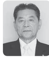
色麻町長 はやさか りえつ 早坂 利悦