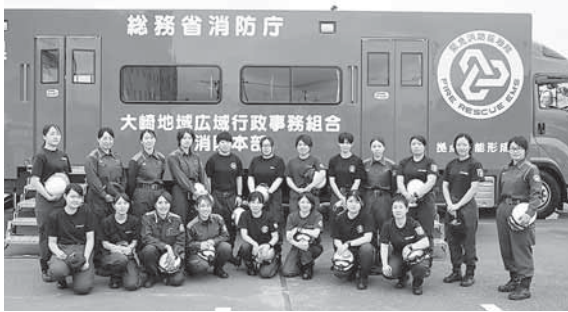
▲今回は多くの女性消防職員が参加

7月21日に大崎広域消防本部を会場として、緊急消防援助隊の派遣部隊を支援する訓練を実施し、県内の消防本部から84名の消防職員（うち20名は女性職員）が参加しました。 この訓練では、資機材の輸送から大型テントの設営、炊事用具の取り扱いなどの訓練を行いました。大規模自然災害で被災地へ派遣された部隊への活動支援を目的として行いました。 また、この訓練は一般に公開し、防災センターの役割を備えた「道の駅おおさき」の利用者などが関心を持って見学に訪れました。